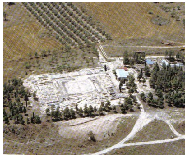
Εικ. 2 Το ανάκτορο της Δημητριάδας (αεροφωτογραφία)

Οι ανασκαφικές εργασίες στην αρχαία Δημητριάδα ξεκίνησαν στο τέλος του 19ου αιώνα και συνεχίζονται μέχρι σήμερα. Ο Α. Άρβανιτόπουλος ανέσκαψε σε μεγάλη έκταση το τείχος και τους πύργους του, καθώς και τα νεκροταφεία, τα ιερά και μέρος του ανακτόρου και του θεάτρου. Άνασκαφές πραγματοποιήθηκαν ακόμη την περίοδο 1956-1961 από τον Δ. Θεοχάρη στο θέατρο και στο ανάκτορο και την περίοδο 1967-1981 από Γερμανούς αρχαιολόγους με επικεφαλής τον V. Milošic. Από το 1981, τέλος, διενεργούνται συστηματικές και σωστικές ανασκαφές από την ΙΓ' Έφορεία Προϊστορικών και Κλασικών Αρχαιοτήτων.