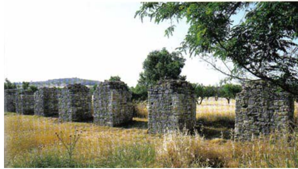
Εικ. 4 Το ύδραγωγείο της Δημητριάδας

Δυτικότερα του αρχαίου θεάτρου, πάνω στο βραχώδη λόφο, βρίσκεται το Ήρωο. Αποτελείται από έναν ορθογώνιο περιβόλο και ένα κεντρικό κτίσμα, που ήταν επενδεδυμένο με μαρμαρίνη διακόσμηση ίωνικού ρυθμού. Πιθανολογείται, ότι πρόκειται για ταφικό μνημείο – μανσωλείο, που έμεινε ατελείωτο και προοριζόταν για τη λατρεία του ήρωα κτίστη της πόλης, τον θεοποιημένο Δημήτριο.