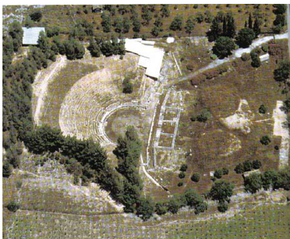
Εικ. 3 Το θέατρο της Δημητριάδας (αεροφωτογραφία)

Νότια του ανακτόρου, διαμορφωμένη σε πλάτωμα του εδάφους και συνδεδεμένη με δρόμο με το ανάκτορο βρίσκεται η Ίερη Άγορά, όπως αναφέρεται σε επιγραφές της πόλης. Είναι ένταγμένη στον πολεοδομικό ιστό της πόλης και τουλάχιστον στη δυτική της πλευρά έκλεινε με στοά. Στο κέντρο της έντοπίστηκε ο μικρός ιωνικός περίπτερος ναός της Ίωλκίας Άρτεμης, διαστάσεων 15 x 9 περίπου μ.